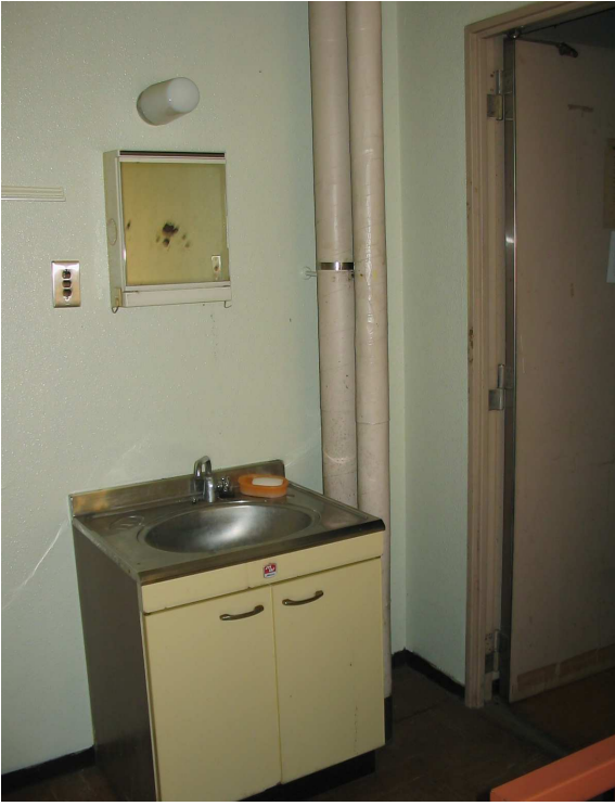
居室内 (3) 洗面台