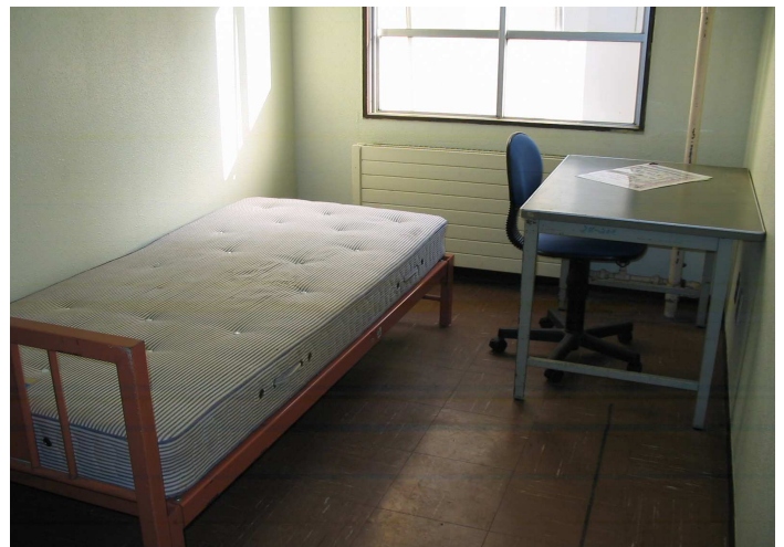
居室内 (2) 備品 机 イス ベッド