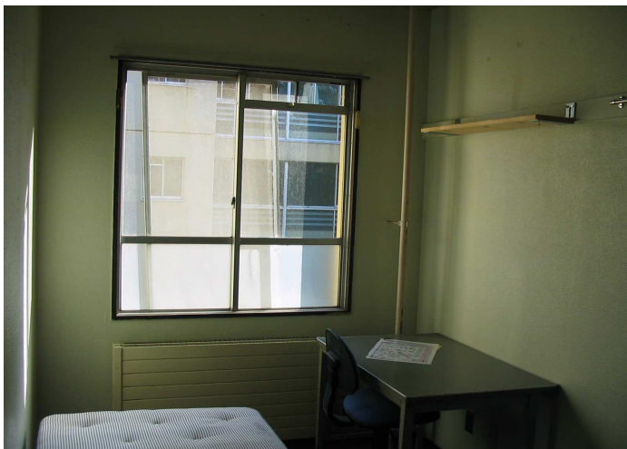
居室内 (1) パネルヒーター